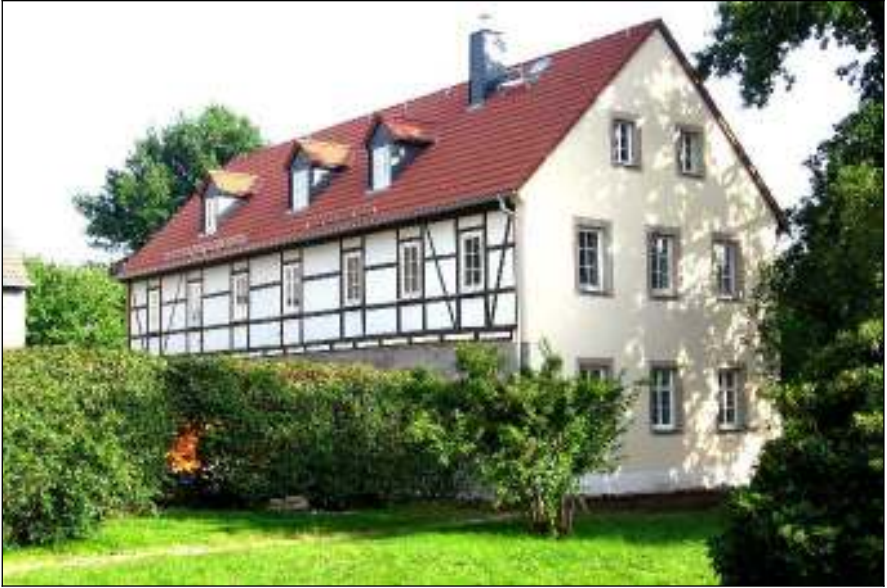
Das neue Haus, das den Namen „Hoffnung“ trägt.

rie, alljährlich ein überregionales Jugendfestival mit dem seltsamen Namen „Bietz“ zu veranstalten. Eine schöne moderne Küche sorgt für eine gute Verpflegung.