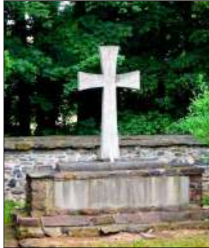
Denkmal für die Gefallenen 1870/71