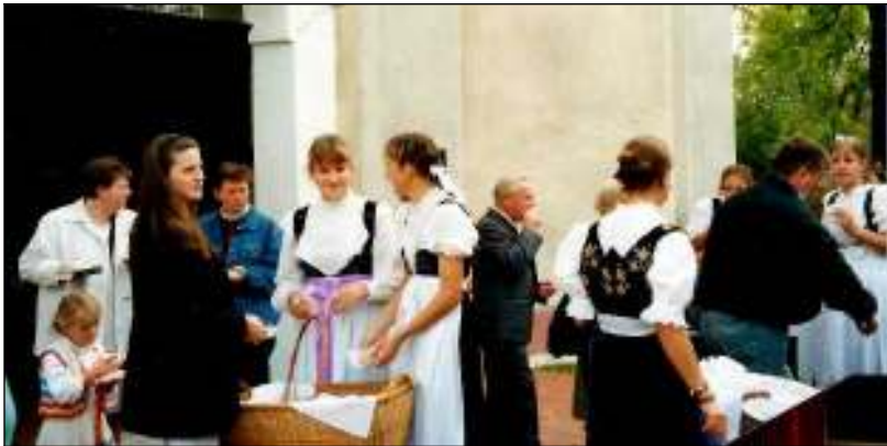
Erntedankfest in Drogomysl am 1. Oktober 2000

Dass die Glocken in Pappendorf noch „von Hand“ geläutet werden müssen, wird zunehmend zum Problem. Es fehlt einfach an „Läutejungen“. Und für die Pfarrfrau Gisela Richter ist es zunehmend eine zu große Belastung, täglich mehrmals zum Läuten auf den Turm zu steigen. Eine Lösung gibt es nur mit elektrischen Antrieben. Doch endlich ist es geschafft.