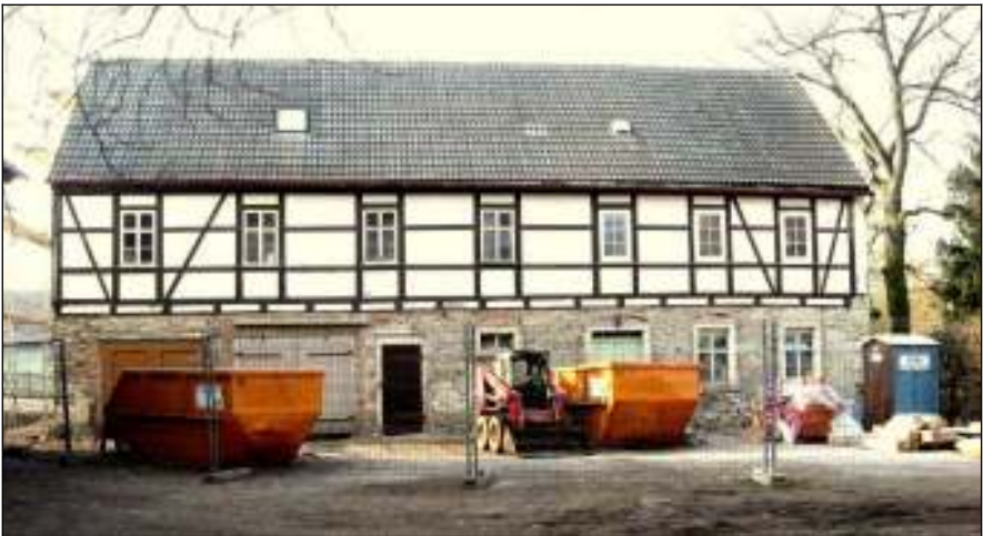
Das „Nebenhaus“: Beginn der Rekonstruktion im Jahre 2010

Im Jahre 1873 wird es ein Raub der Flammen, das Wohn- und Stallhaus des Pfarrgutes . Schnell wird es wieder aufgebaut, denn noch gibt es einen Pächter des Gutes, der das Haus als Unterkunft für seine Familie und für seine Tiere dringend benötigt. Als es kein Pfarrgut mehr gibt, findet es Verwendung für das vielfältige Leben der Kirchgemeinde. So üben in den Räumen die Bläserinnen und Bläser des Posaunenchores und die Sängerinnen und Sänger des Kirchenchores, und es gibt einen „Großmütterchenachmittag“, einen Frauentag und einen Männerabend.