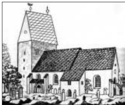
und eventuell 1424 bis 1772

Am 1. Advent 1840 wird das neu erbaute Kirchenschiff durch den Nossener Superintendenten Johann Christian Große feierlich geweiht. Besondere Gäste sind die Pfarrer von Hainichen, Bocken-