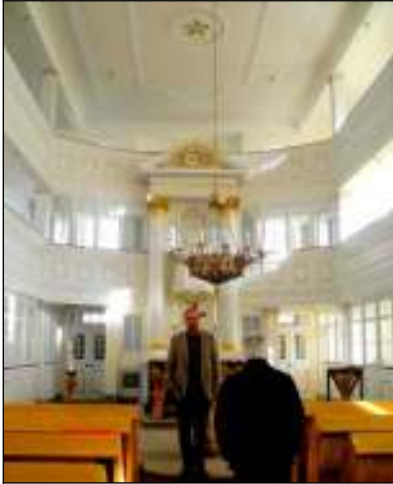
Die Kirche in Seifersbach und ihr

Finanzierung Nutzholz im Pfarrwald im Werte von 3000 Talern schlagen und verkaufen und dieses Geld für den Bau verwenden darf. Kurios mutet aber an, dass die Kirchgemeinde das Geld von der Pfarrholzkasse nur leihen kann und in Raten von jährlich 100 Talern zuzüglich Zinsen innerhalb der nächsten 30 Jahre zurückzahlen muss.