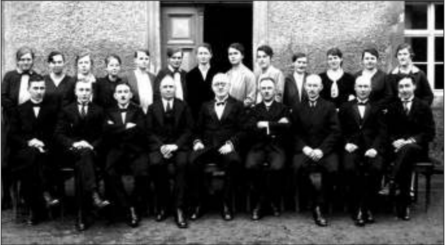
Der Kirchenchor im Jahre 1927 am Gasthof