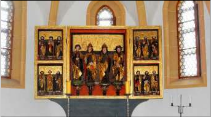
Der Pappendorfer Altar von 1520 - heute in der Kapelle der Burg Mildenstein in Leisnig zu besichtigen

So zum Beispiel die Breitwesttürme der Kirchen von Langhennersdorf, Pappendorf und Marbach". Wir kommen später noch einmal darauf zurück.