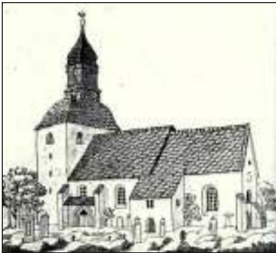
Vor dem Umbau 1839 -