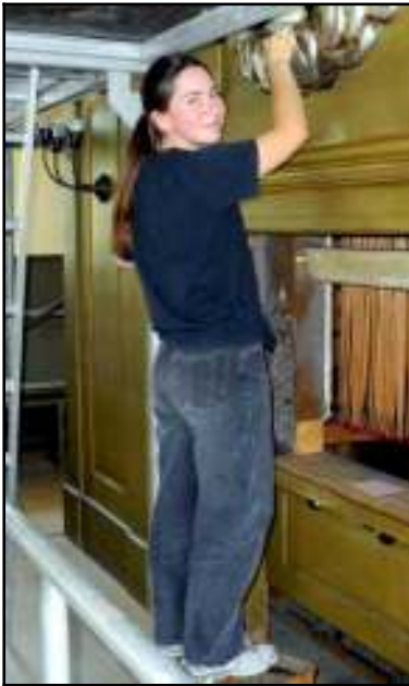
Eine Restauratorin bei der Arbeit

Im Nachrichtenblatt vom Februar 2024 gibt es eine gute Nachricht: „Anfang Januar haben wir neue Termine vom Mitteldeutschen Orgelbau A. Voigt erhalten. Ab 11. März wollen sie vor Ort weiterbauen. Eine Fertigstellung ist zu unserer 600-Jahr-Feier zugesagt.“